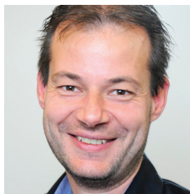
Robert ten Broeke Catharina ziekenhuis